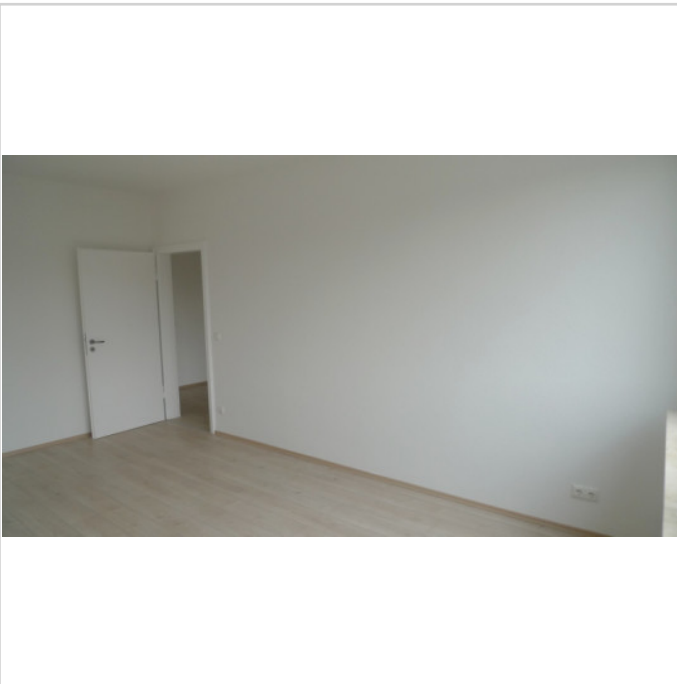
Wohnzimmer Rtg. Diele