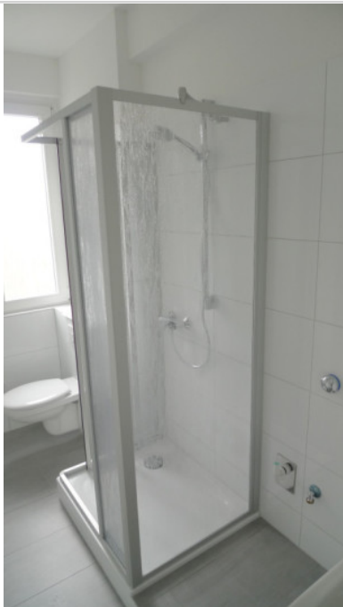
Dusche und WM-Stellplatz